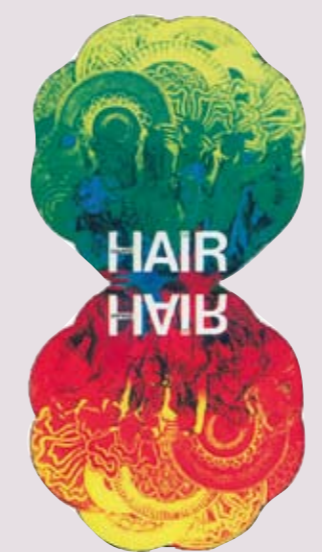
Inszenierung: Philipp Kochheim; Musikalische Leitung: Michael Barfuß

Der zur Armee eingezogene Claude soll zum Kampfeinsatz in Vietnam an die Front geschickt werden. In einer Gruppe von Hippies, die sich um den Stimmführer Berger sammeln, verbringt er die letzten Stunden vor seinem Einsatz. Gemeinsam besingen sie eine Welt von Toleranz, Frieden und Gewaltlosigkeit und beschwören mit Blumen, Räucherstäbchen, Kerzen und Friedenspfeifen ein neues Zeitalter im Sternzeichen des Wassermanns. Längst haben Kulthits wie „Let the sunshine in“, „Aquarius“, „Good morning, Starshine“ und „Hare Krishna“ ihren festen Platz in der Musikgeschichte eingenommen.