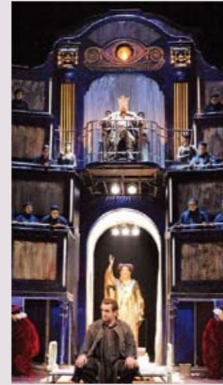
Inszenierung: S. Purcarete, N. Wolcz; Musikalische Leitung: Christopher Sprenger

Ein lebensgefährliches Quiz: Prinzessin Turandot wird nur denjenigen Bewerber königlicher Herkunft heiraten, der ihre drei Rätsel zu lösen vermag. Wer die Probe nicht besteht, ist des Todes. Schon viele Große haben ihr Glück versucht und ihr Leben verloren. Auch Prinz Calaf, im Mondschein dem Zauber Turandots erlegen, fordert die Prinzessin zum (selbst)mörderischen Spiel. Und siegt. Hat er erkannt, was niemand zuvor bemerkte: Dass es nicht gilt, Turandots Stolz zu brechen, sondern die Liebe und das Vertrauen der Traumatisierten zu erringen?