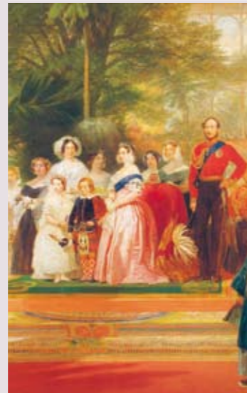
Henry Courtney Selous, Die Eröffnung der Weltausstellung durch Queen Victoria, Öl auf Leinwand

Das Victoria and Albert Museum in London ist das größte Museum der Welt für Kunst und Design. Sein Bestand von über vier Millionen Werken zeugt von legendärem Reichtum und unerschöpflicher Vielseitigkeit. Die Erfolgsgeschichte des Museums begann 1857 mit der Gründung des Vorgängerbaus, des South Kensington Museum. Zahlreiche erlesene Objekte rekonstruieren die Entstehungsgeschichte und den Einfluss des Museums, das mit seiner Präsentation ein Vorbild für kunstgewerbliche Museen wurde.